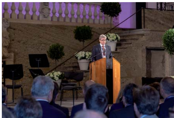
Eröffnungsrede von Präsident Kleibel

Die Salzburger Rechtsanwaltskammer und der ÖRAK bedanken sich bei folgenden Sponsoren des Anwaltstags: