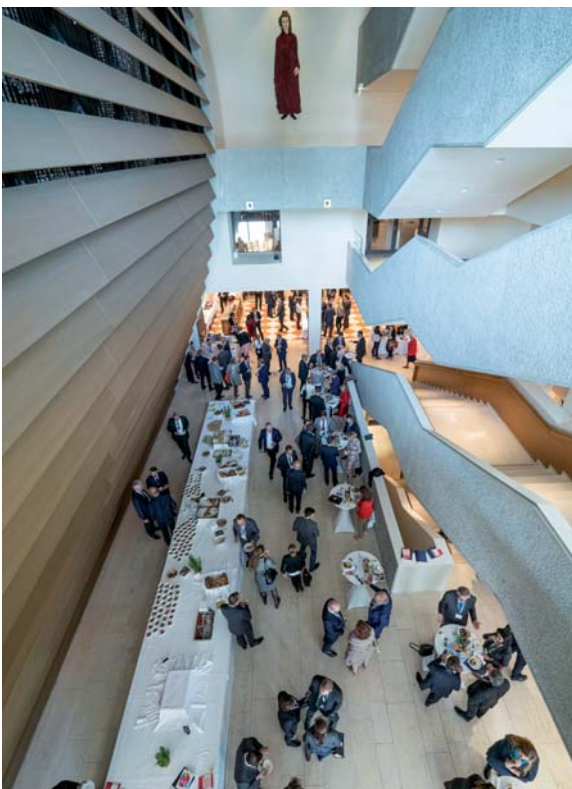
Das Festspielhaus als tolle Kulisse für den Anwaltstag 2019