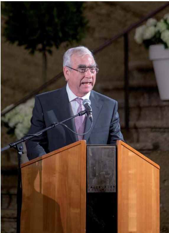
Festredner BM aD Dr. Theodor Waigel