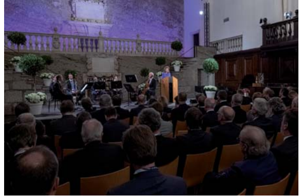
Grußworte von Bundeskanzlerin Bierlein

Als weiterer Festredner konnte der ehemalige deutsche BM der Finanzen und Ehrenvorsitzender der CSU Dr. Theodor Waigel gewonnen werden, der auch als Rechtsanwalt tätig ist. Er warnte davor, in der aktuellen politischen Stimmungslage in Europa Entwicklungen zu verschlafen, die einen schleichenden Wandel zum Totalitarismus fördern. Für die musikalische Umrahmung des Festakts sorgten Mitglieder des Mozarteumorchesters.