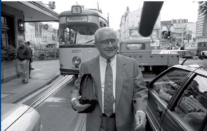
DDR-Anwalt Wolfgang Heinrich Vogel am 21. 7. 1986 bei seinem Eintreffen vor dem Landgericht Bonn. Für seine Verdienste wurde er ua mit dem Vaterländischen Verdienstorden der DDR in Gold und dem Großen Stern der Völkerfreundschaft der Sowjetunion ausgezeichnet.