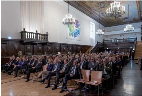
Zahlreiche Gäste wohnten dem Festakt im Haus für Mozart bei