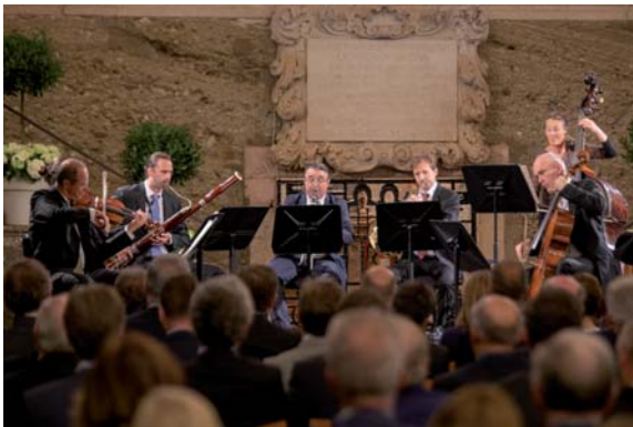
Musikalische Untermalung durch Mitglieder des Mozarteumorchesters